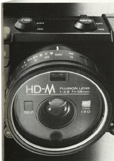
Den kraftige gummiring gør det nemt at fokusere HD-M under vanskelige forhold. Samtidig dækker beskyttelsesglasset både objektiv, søger, ISO-vindue, selvuløserblink og lysmålervindue.